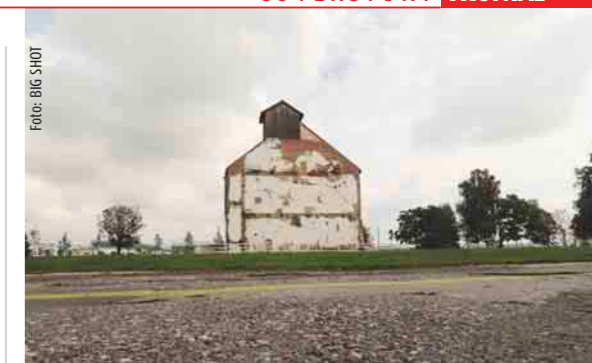
Reininghaus: Brachlandschaft soll City werden.